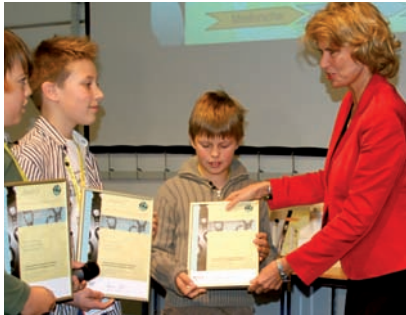
In 2007 überreichte die Parlamentarische Staatssekretärin Dagmar Wöhrl (BMWi) die Siegerurkunden, hier an den Eifeler Nachwuchs.

Neben Privaterfindern richtet sich „i hoch 3“ insbesondere an Kinder und Jugendliche aus Erfinderclubs, inzwischen schon zum zehnten Mal. Die besten drei Erfindungen der Jugendlichen werden mit insgesamt 6.000 EUR prämiert, die der Kinder immerhin noch mit insgesamt 3.000 EUR.