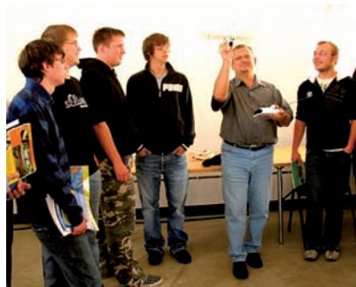
Jugendarbeit vor Ort in St. Wendel