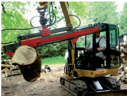
Neuartiger Baggeraufsatz - eine Erfindung aus der SIGNO-Patentschmiede Westerwald e.V.

Überprüfen Sie, ob Ihre Einträge noch aktuell sind. Oder gibt es vielleicht Erfindungen, die dort noch nicht erfasst wurden? Dann melden Sie sie uns mit dem bekannten Erfassungsfomular und einem Foto.