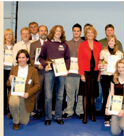
Die Parlamentarische Staatssekretärin Dagmar Wöhrl bei der Preisverleihung „i hoch 3“ 2007.

Aufgrund des interessanten SIGNO-Rahmenprogramms (Symposium, Preisverleihung „i hoch 3“) würden wir uns über einen Besuch am Freitag, den 31. Oktober, freuen.