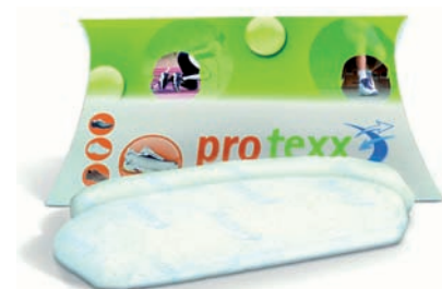
Das pro texx-Schuhkissen aus dem SIGNO Innovationsforum Niederrhein e.V.

Dieses Forum zeigt, welche Erfindungen aus den Erfinderclubs den Weg in den Markt geschafft haben. Die ursprüngliche Intention, einen Online-Shop unter unserer URL zu etablieren, konnten wir aus politischen Erwägungen leider nicht aufrecht halten.