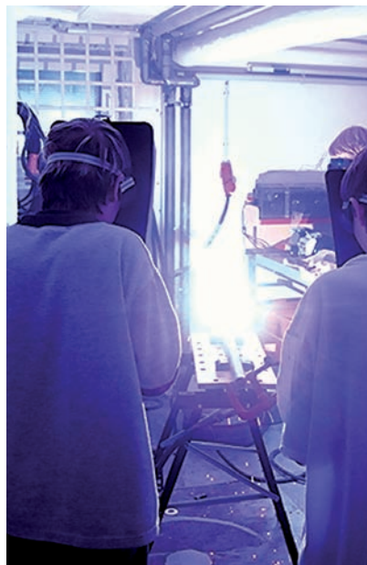
Schüler beim Bau eines Prototypen

Mehr unter www.sicherheit-macht-schule.de