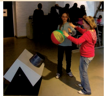
Technik und Naturwissenschaft live erleben in der Phänomenta

Weitere Infos unter: www.phaenomenta.com